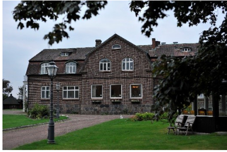
STF Vandrarhem Jonstorp