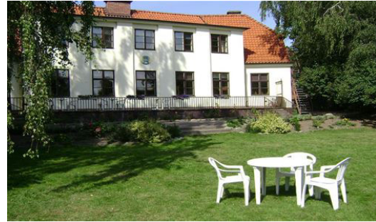
STF Vandrarhem Landskrona