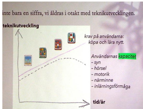
Teknikutveckling och människans ålder divergerar