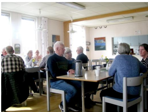
Gott med kaffe och kaka

Ett av de senare påfunden är AI, Artificiell Intelligens, som är ett användbart verktyg i många sammanhang. Två appar som kan vara intressanta är Suno - AI Songs och ChatGPT (på svenska). Dessa är gratis att ladda ner men kan kosta något inuti appen för vissa funktioner.