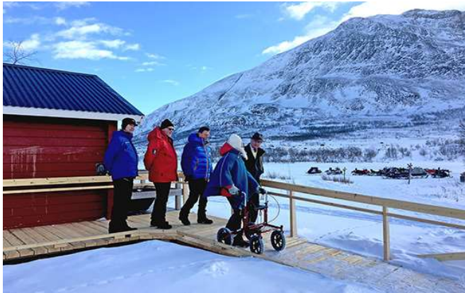
Bastubyggnaden med fjället Giron i bakgrunden. Bilden är tagen i samband med att Kung Carl Gustaf besökte stugan vid invigningen av tillgänglighetsanpassningen den 25 mars 2017.