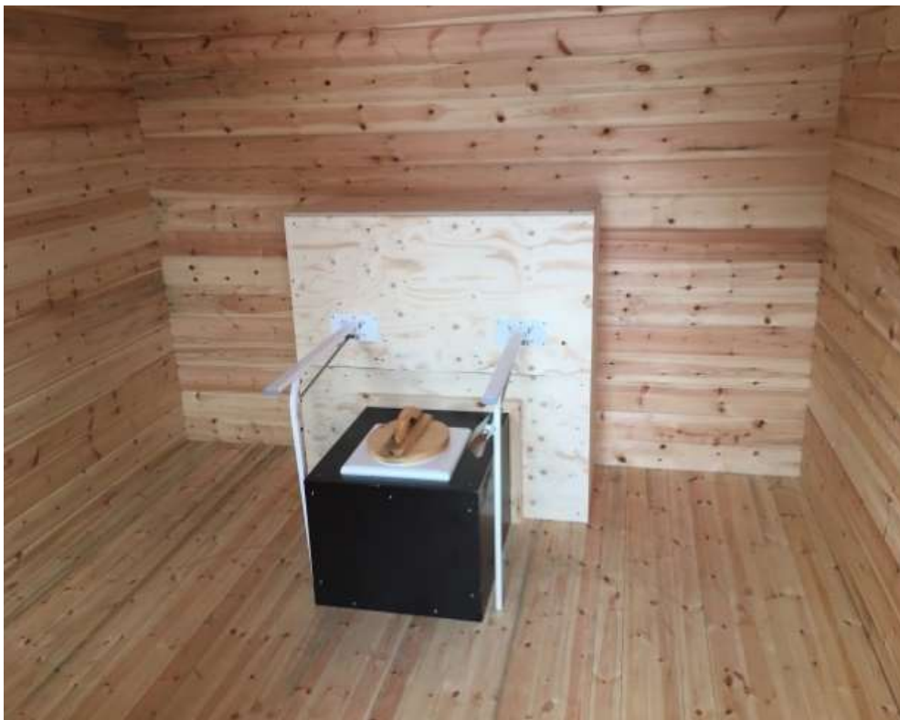
Tillgängligt från både höger och vänster sida

I Abiskojaure finns inte rinnande vatten, vanlig uppvärmning eller el. Alla som vistas här hjälps åt att hämta vatten, vintertid i ett vattenhål uppborrat i isen ca 150 meter bort från stugan, sommartid i jokken ca 200 meter bort. Alla i stugan hjälps också åt med att hämta ved, bära ut slask och sopor samt källsortera. I det kombinerade köks- och matrummet finns gasollampa på väggen som ger allmänbelysning. I övrigt används levande ljus. Det är lämpligt att ta med stearinljus, tändstickor, ficklampa och kanske även pannlampa. Det finns smidiga, lätta lampor med solceller som laddas av dagsljus vilka är praktiska att använda i stugan på kvällen, ta gärna med sådan. Sommartid är det midnattssol från slutet av maj till mitten av juli med dagsljus natten igenom. Vintertid är dagarna mycket korta. Ska man ut till dasset kvällstid eller mitt i natten är pannlampa perfekt så man har händerna fria när man tar sig de knappt 20 metrarna. I stugan finns kuddar, täcke och bekväma madrasser i sängarna. Som gäst tar man med sig sovsäck / sovlakan och handduk. Tänk på att det kan bli kyligt frampå småtimmarna vintertid, när elden i kaminen har slocknat. Kaminerna är de enda värmekällorna i stugorna. I bastubyggnaden finns omklädningsrum och tvättrum där det går att värma vatten och man använder tvättfat. Det är dambastu, herrbastu och mixad bastu vid olika tider på kvällen. Bastun sköts av stugvärdarna.